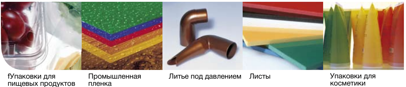
Упаковки для пищевых продуктов