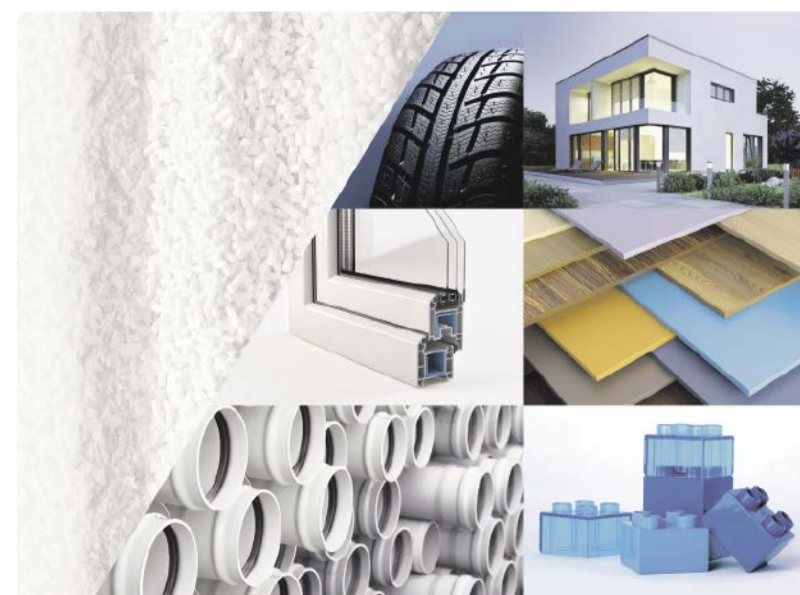
Baerlocher ist einer der weltweit führenden Hersteller von Additiven für die Kunststoffindustrie sowie zahlreiche Nonpolymer-Anwendungen